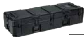
case rigido (angoli, segmenti, tela, stativi)