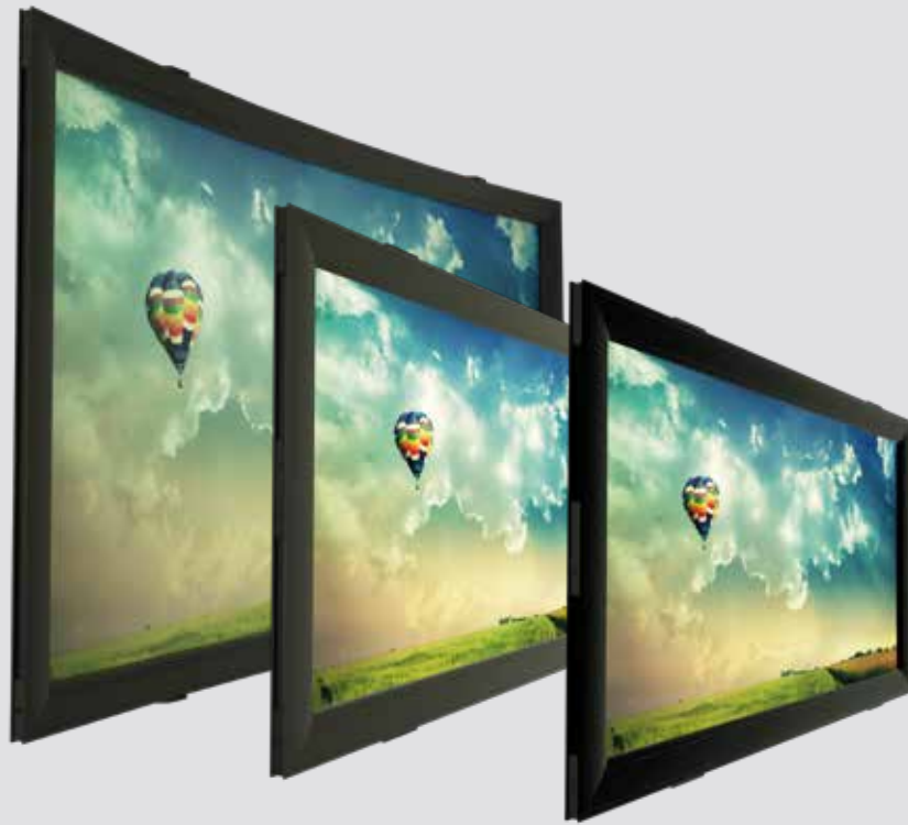
Curved Classic Velvet